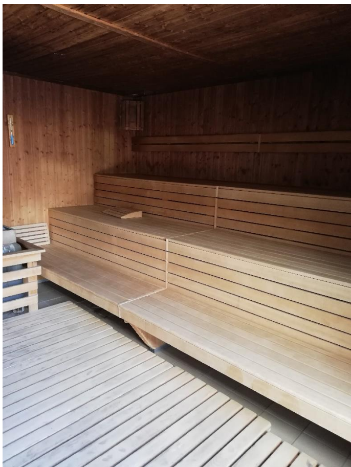
Rysunek 3 - siedziska drewniane z drewna abachi