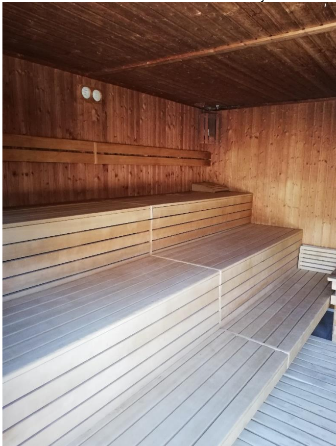
Rysunek 2 - siedziska drewniane z drewna abachi