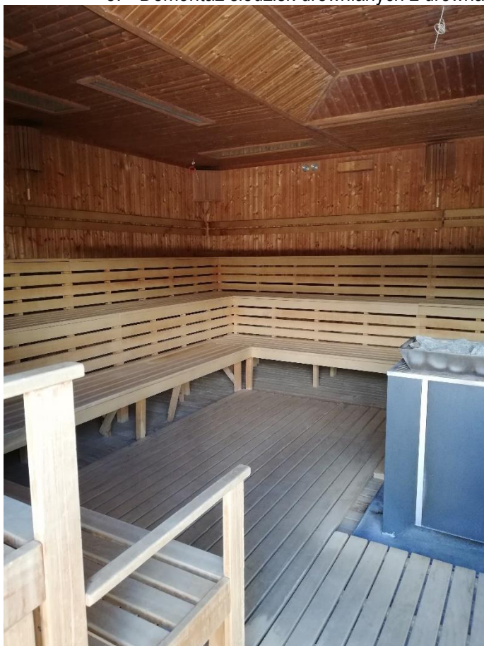
Rysunek 5 - siedziska z drewna abachi w saunie zewnętrznej fińskiej modułowej