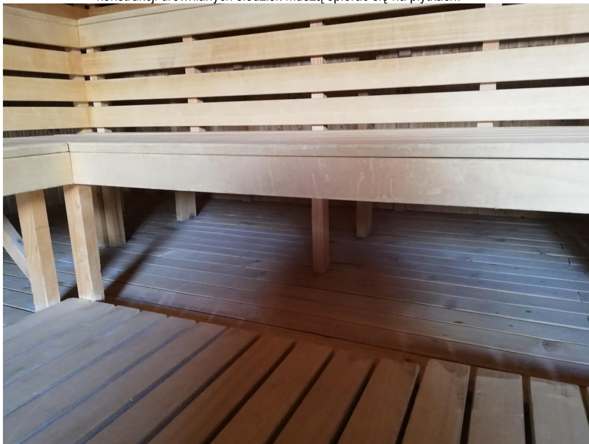
Rysunek 4 - konstrukcja siedzisk drewnianych w saunie zewnętrznej fińskiej modułowej